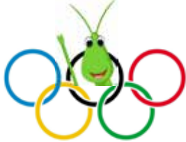
1. Ispringer Ferien-Olympiade