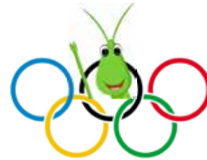
1. Ispringer Ferien-Olympiade

letzte Woche habe ich Euch bereits von meinem Plan für die