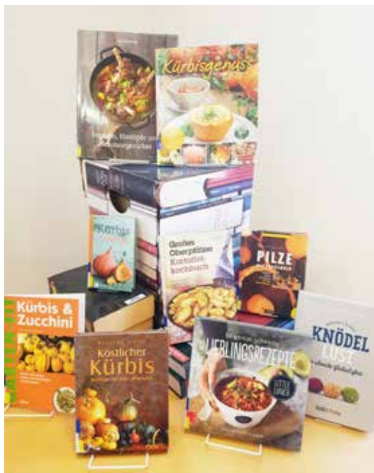
Kochbücher für den Herbst

Liebe Leser, entdecken Sie unser großes Angebot an Kochbüchern . Immer mehr Menschen wollen sich saisonal und regional ernähren. Die Vielseitigkeit von Kürbis jenseits der klassischen Kürbiscremesuppe oder auch Pilze haben jetzt Saison.