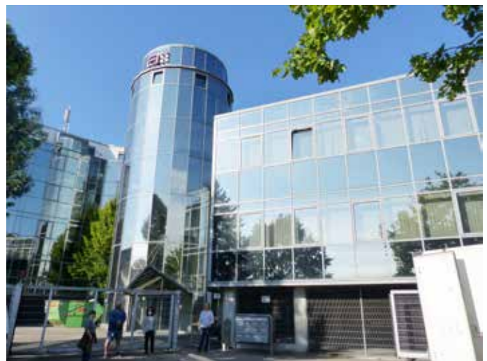
Die Außenstelle des Enzkreis-Jobcenters zieht am 14. Oktober von Mühlacker nach Eutingen um. Das Foto zeigt das neue Domizil Im Ludlein 6.

Ab Freitag, 15. Oktober, ist die Jobcenter-Außenstelle dann in den neuen Räumen in Eutingen wieder zu den gewohnten Zeiten geöffnet und erreichbar – wie bisher allerdings nur nach vorheriger Terminvereinbarung. Auch die Telefonnummern bleiben gleich. (enz)