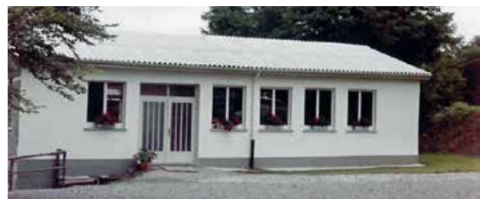
Das Vereinsheim in den 1980er-Jahren.

Der Verein wuchs stetig und wurde mit vielen Zuchten in ganz Deutschland bekannt, die logische Folgerung war der Bau eines Vereinsheims im Jahre 1965 am Winterrain. Zu Beginn der 2010er-Jahre brannte dieses Heim ab, welches an selber Stelle wieder, etwas modifizierter, aufgebaut wurde. Eine Zuchtanlage wurde geplant, um den Bestand der Zuchten zu sichern, da in den Neubaugebieten Tierhaltung nicht mehr möglich war. Dank des Landes Baden-Württemberg und der Gemeinde Ispringen mit Herrn Übelhör an der Spitze konnte dieses Vorhaben durchgeführt werden. Viele Tiere aus dieser Anlage haben den Namen Ispringen auf vielen Kreis-, Landes-, Bundes- und Europaschauen vertreten und bekannt gemacht.