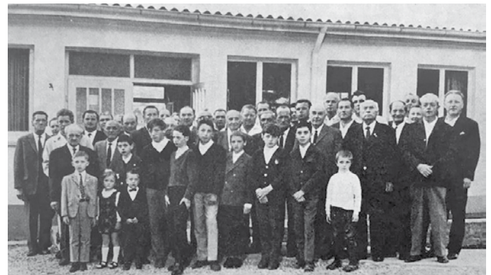
Der Kleintierzuchtverein Ispringen bei der Einweihung seines Vereinsheims 1965.

Der Verein wuchs stetig und wurde mit vielen Zuchten in ganz Deutschland bekannt, die logische Folgerung war der Bau eines Vereinsheims im Jahre 1965 am Winterrain. Zu Beginn der 2010er-Jahre brannte dieses Heim ab, welches an selber Stelle wieder, etwas modifizierter, aufgebaut wurde. Eine Zuchtanlage wurde geplant, um den Bestand der Zuchten zu sichern, da in den Neubaugebieten Tierhaltung nicht mehr möglich war. Dank des Landes Baden-Württemberg und der Gemeinde Ispringen mit Herrn Übelhör an der Spitze konnte dieses Vorhaben durchgeführt werden. Viele Tiere aus dieser Anlage haben den Namen Ispringen auf vielen Kreis-, Landes-, Bundes- und Europaschauen vertreten und bekannt gemacht.