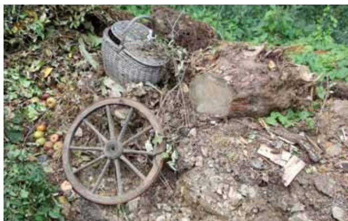
Auf den Häckselplätzen im Enzkreis gibt es immer mal wieder Probleme mit sog. Störstoffen.

Enzkreis. „Mit 31 Häckselplätzen bieten wir der Bevölkerung ein dichtes Netz von Abgabestellen für Baum- und Strauchschnitt sowie Grüngut“, beschreibt Alexander Pfeiffer, Leiter des Amtes für Abfallwirtschaft, das nach seiner Auffassung gute Entsorgungsangebot des Enzkreises. „Leider bereiten uns immer wieder Anlieferungen außerhalb der Öffnungszeiten sowie Anlieferungen, die nicht aus dem Enzkreis kommen, Probleme“, bedauert er im gleichen Atemzug.