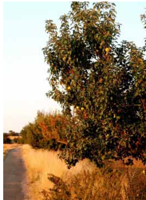
Abendstimmung am Streuobststreifen an der Eisinger Grenze

Wie schon in den letzten Jahren stellt die Gemeinde auf den Streuobststreifen am Modellflugplatz und am Grenzweg zur Eisinger Gemarkung den an Streuobst, also Äpfeln und Birnen, Interessierten die dort stehenden Bäume zum Abernten zur Verfügung. Der diesjährige Ertrag ist eher dürftig, einige Sorten sind ein Totalausfall und viele Bäume werfen Obst ab, das schon von Fäulnis angesteckt ist. Geschuldet ist dies vor allem der lang anhaltenden Trockenheit im Juli und August. Dennoch gibt es einige Obsttragende Bäume.