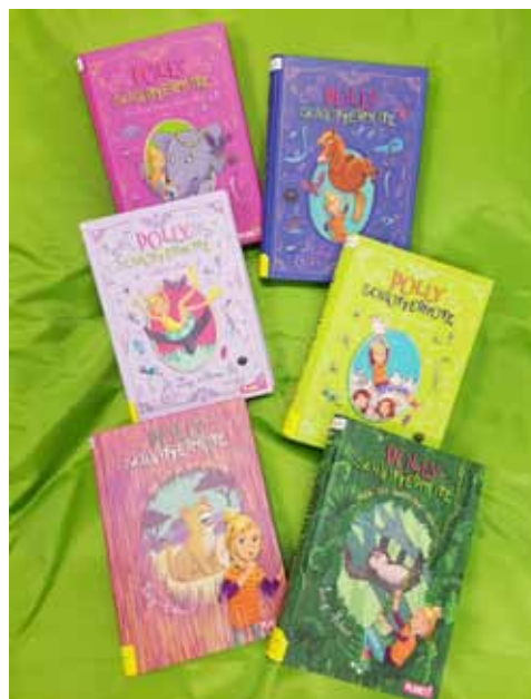
Bücher von Polly Schlottermotz

Potzblitz! Seit Polly den neuen Eckzahn hat, weiß sie von einem lange gehüteten Familiengeheimnis – und das stellt ihr Leben ganz schön auf den Kopf! Es ist zwar super, dass sie plötzlich den fiesen Marvin wie einen Pillepallepopel durch die Luft schnipsen kann, trotzdem ist da diese Prüfung vor dem Siebenschläferrat, die sie erst bestehen muss, bevor sie wieder bei ihrer Familie leben darf. Und so verlässt Polly schweren Herzens ihr geliebtes Zuhause, um sich bei Tante Winnie auf die Prüfung vorzubereiten. Zum Glück gibt es den sprechenden Fledermäuserich Adlerauge. Der ist zwar blind wie ein Maulwurf, öffnet Polly aber die Augen: Manchmal ist es ziemlich cool, ein bisschen anders zu sein ... Also seid gespannt wie die Abenteuer von Polly Schlottermotz enden.