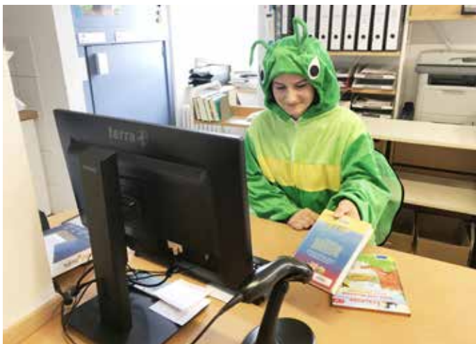
Springi in der Gemeindebücherei Ispringen.

Hallo liebe Kinder und Jugendliche, am Montag war ich wieder fleißig und habe einige Flyer für unser Sommerferienprogramm verteilt. Dieses Mal hat es mich in die Gemeindebücherei gezogen und ich habe dort einen Einblick hinter die Kulissen bekommen. Von der Ausleihe der Bücher bis zur Einrichtung eines eBooks konnte ich den Mitarbeiterinnen unter die Arme greifen. Ich habe vieles über die tolle Auswahl an Büchern, DVD's und Hörbüchern gelernt. Leider verging die Zeit wie im Flug, aber ich werde bestimmt wieder kommen. Einige von Euch habe ich schon kennengelernt und ich würde mich freuen, wenn ich auch Dir in Ispringen mal über den Weg laufen würde. Ach jetzt habe ich fast das Wichtigste vergessen... Natürlich möchte ich Euch nochmals herzlich zum Sommerferienprogramm einzuladen. Viele tolle Programmpunkte sind noch nicht ausgebucht und warten darauf von Euch entdeckt zu werden.