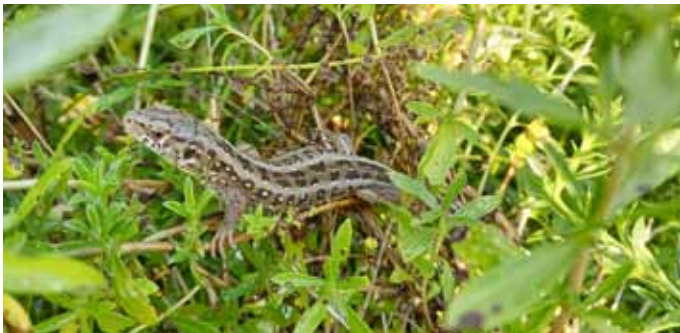
Neben Igel fallen leider auch Eidechsen, Spinnen und Blindschleichen regelmäßig Mährobotern zum Opfer. (enz)

Was in der Naturschutzpraxis auf großen Wiesen umgesetzt wird, das kann auch als Orientierung für den Garten dienen: Ungemähte Inseln nehmen dabei beispielsweise eine wichtige Rolle als „Trittsteine“ ein. Damit Tiere und auch Samen von Trittstein zu Trittstein wandern können, sollten sie in relativer Nähe zueinander angeordnet sein, sonst werden sie schnell zur „Falle“. Geeignete Elemente dafür können Beete mit heimischen Wildstauden, aber auch Hecken, Trockenmauern und Steinhaufen, Wasserstellen und „wilde Ecken“ sein. So lässt sich der gesamte Garten nicht nur als Erholungs-, sondern auch als wertvoller Lebensraum und Trittstein für die heimische Artenvielfalt gestalten. (enz)