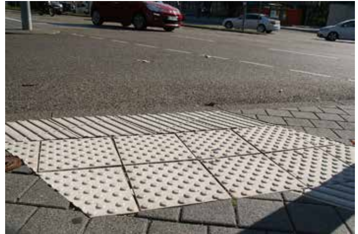
Blindenleitsystem mit Aufmerksamkeitsfeldern

Wir hoffen, dass auch bei der Fußgängerampel an der Eisenbahnstraße/Kämpfelbachquelle früher oder später – besser aber früher – eine ähnliche Einrichtung installiert wird.